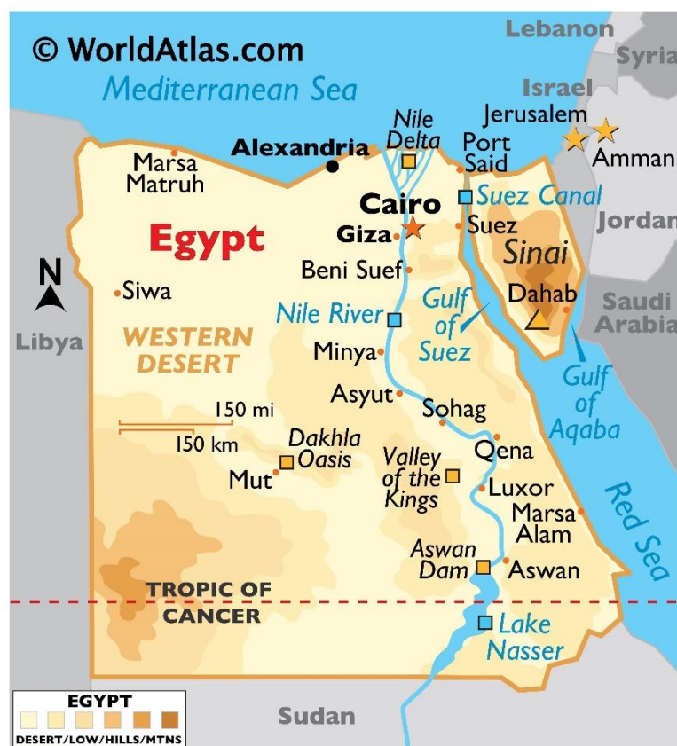
Ilustracja 3. Mapa Egiptu